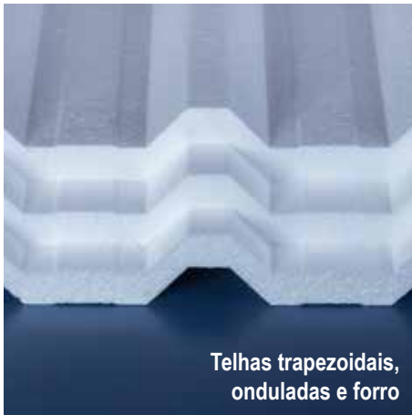
Telhas trapezoidais, onduladas e forro